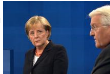
Kanzlerin Merkel und Vizekanzler Steinmeier - bleibt alles beim alten?

Doch auch eine Große Koalition birgt Risiken für Merkel: Schließlich ist davon auszugehen, dass die Unzufriedenheit in ihren wirtschaftsnahen und konservativen Parteiflügeln steigt. Gleichzeitig könnte sich die SPD in zwei Jahren mit einem rot-rot-grünen Bündnis drohen - etwa nach einem Rückzug ihres Feindes Oskar Lafontaine aus der Spitze der Linkspartei.