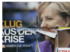
Angela Merkel

BERLIN. Gestern Kundgebungen in Bad Kissingen und Wuppertal. Morgen ein Fototermin mit US-Präsident Barack Obama in Pittsburgh auf der anderen Seite des Atlantiks. Samstag das Kampagnen-Finale in Berlin-Treptow. Im Wahl-Endspurt kann sich Kanzlerin Angela Merkel keine Verschnaufpause gönnen.